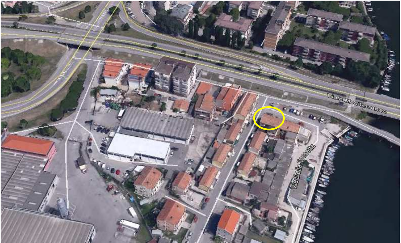
Immagine da satellite